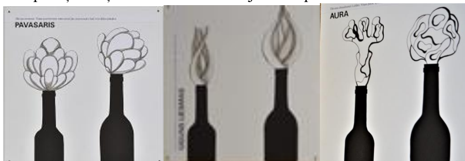
8.att. Pudeļu korķu planšetes.

Paraugam mērķpersonas raksturojums un rezultāts līdzīgam uzdevumam, kur kā dizaina priekšmets izvēlēts dekoratīvs pudeļu korķis. Uzdevuma nosacījumi tie paši.