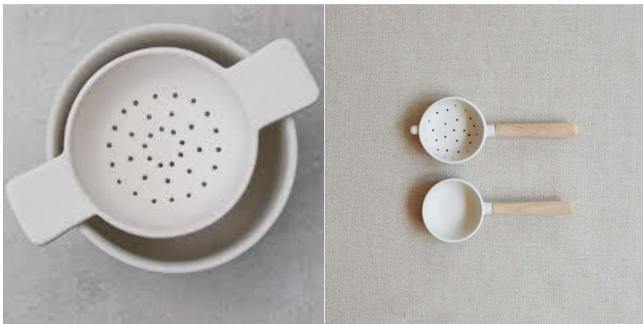
1., 2.att.. https://lovetea.com.au/shop/sue-pryke-tea-strainer

Lai varētu piedāvāt jaunu ideju, ir jāzina, jāorientējas dizaina piedāvājumā, jābūt priekšstatam par to, kas pasaulē šajā jomā, tēmā, materiālā jau radīts.