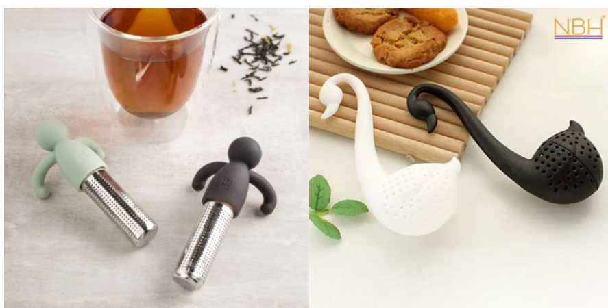
3., 4.att. https://www.kitchenstuffplus.com/