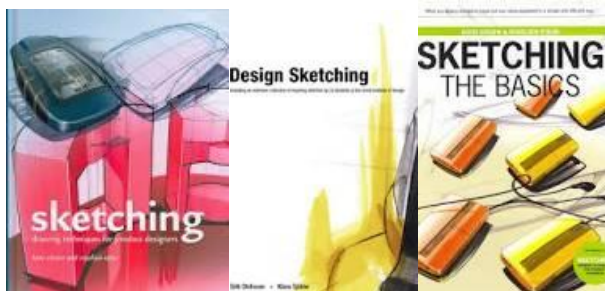
20.-22.att.. Nodaļā un skolas bibliotēkā pieejamās skicēšanas grāmatas