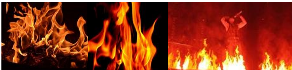
13.-15.att. Iedvesmas avoti darbam “Uguns liesmas”