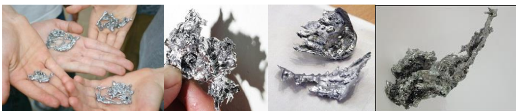
16.-19.att.Iedvesmas avoti darbam “Aura”