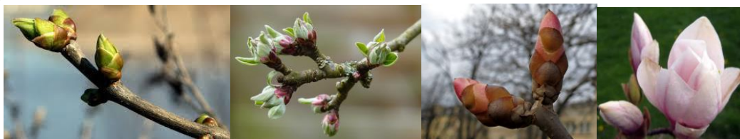
9.-12.att.Iedvesmas avoti darbam “Pavasaris” – iedvesmas avots – pumpuri