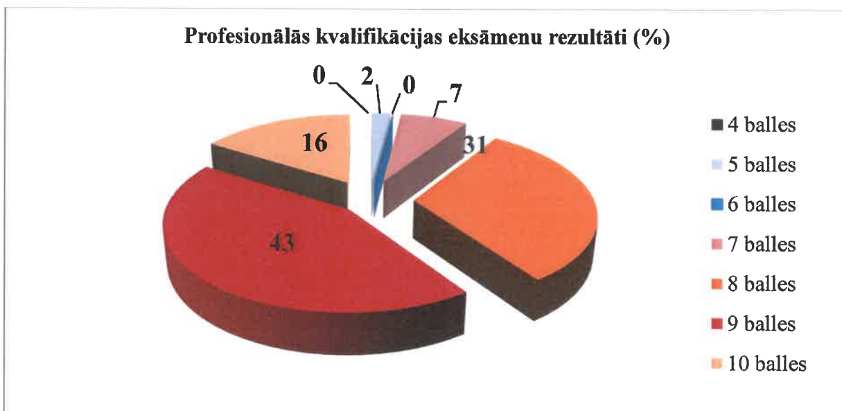
2. attēls. Profesionālās kvalifikācijas eksāmena rezultāti(%)

2016./2017. mācību gadā profesionālās kvalifikācijas eksāmenos vidējais vērtējums minēto kvalifikāciju ieguvei bija „8,61” balles.