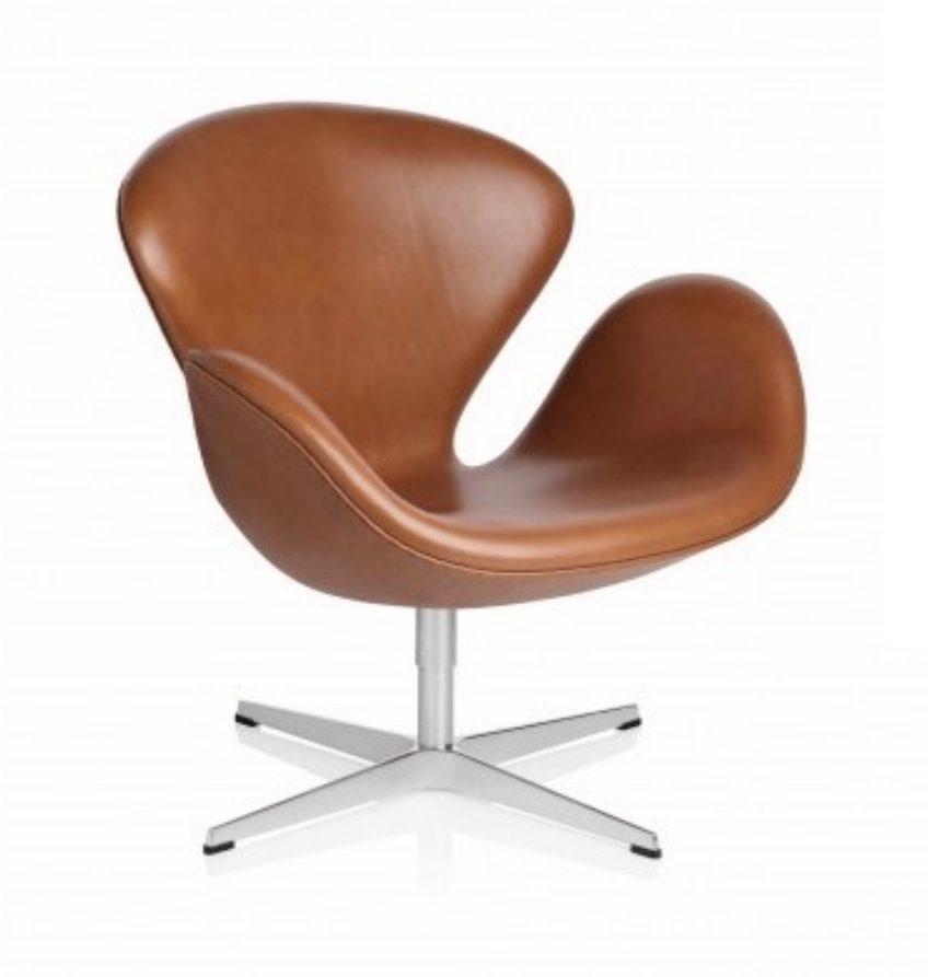
Arne Jacobsen "The Swan" 1958, DKK